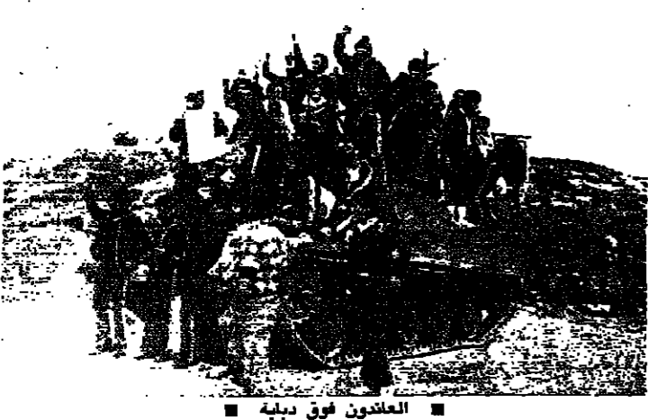
العائدون فوق ديبية